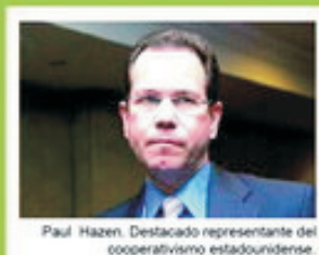
Paul Hazen. Destacado representante del cooperativismo estadounidense

Paul Hazen destacó que en su país existen 29,200 cooperativas, que reúnen a 120 millones de asociados. Emplean a 2 millones de personas y destinan 3 billones de dólares en activos. Las principales son las de crédito, con un total de 8,000 y las cooperativas agrícolas, que suman unas 3,000. Al mismo tiempo destacó que el cooperativismo representa la sexta economía del planeta.