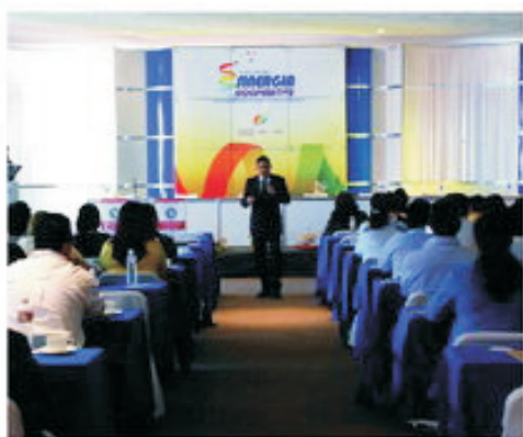
De gran interés fueron las ponencias presentadas en el encuentro. Se fortaleció en conocimiento el sector.

Guanajuato, México. Los días 29 y 30 de septiembre del 2010 se realizó en esta capital, el primer encuentro "Sinergia Cooperativa" promovido por la Alianza Cooperativa Internacional en Américas, el Comité de Cooperativas Financieras (COFIA), el Comité Regional de Equidad de Género (CREG) y el Comité de Juventud de ACI-Américas.