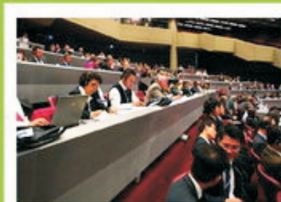
Cada día el cooperativismo es de mayor interés para los legisladores por su alto impacto económico y social

Red de Parlamentarios de las Américas e invitaron a homólogos regionales para que se involucren y comprometan con el cooperativismo y su incidencia en la región.