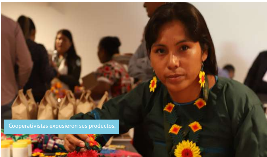
Cooperativistas expusieron sus productos.

Se habló sobre la falta de conexión a Internet en la zona de la montaña en Guerrero, pero también de la inseguridad en el norte del país, de las oportunidades que tienen las cooperativas como economía incluyente. También distintas cooperativas tuvieron la oportunidad de exponer sus casos de éxito en varios stand desde donde ofrecían sus productos financieros o de consumo.