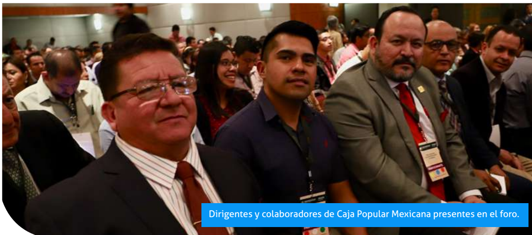
Dirigentes y colaboradores de Caja Popular Mexicana presentes en el foro.

Foro Nacional de Cooperativismo en México