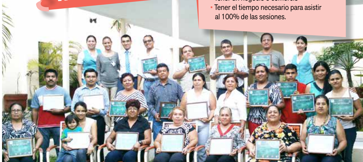
Un negocio organizado aumenta las posibilidades de perdurar.

INSCRÍBASE Todos nuestros programas son ¡GRATIS! www.cpm.coop