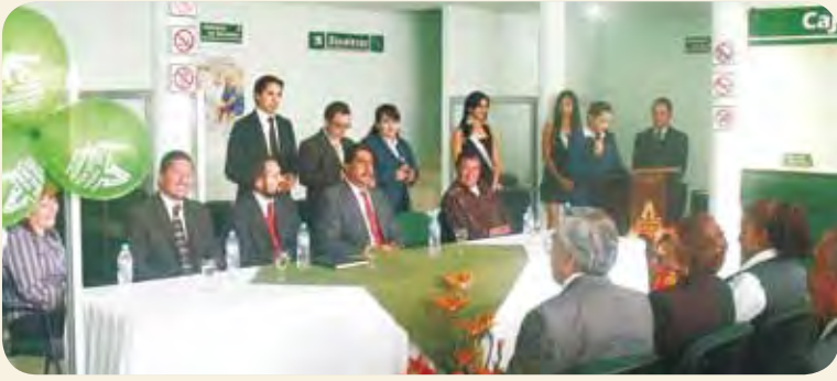
Parte de la ceremonia de reinauguración de la sucursal Tres Cruces.