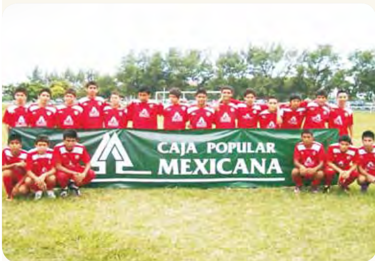
CPM promueve el deporte con niños y adultos mayores.