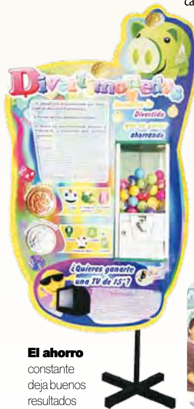
El ahorro constante deja buenos resultados