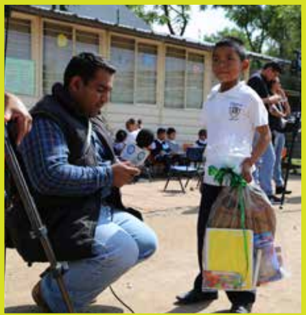
En la escuela estudian niñas y niños otomíes, mixtecos y purépechas.