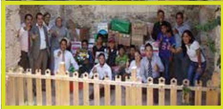
El 18 de agosto los niños recibieron útiles escolares reunidos por Caja Popular Mexicana.