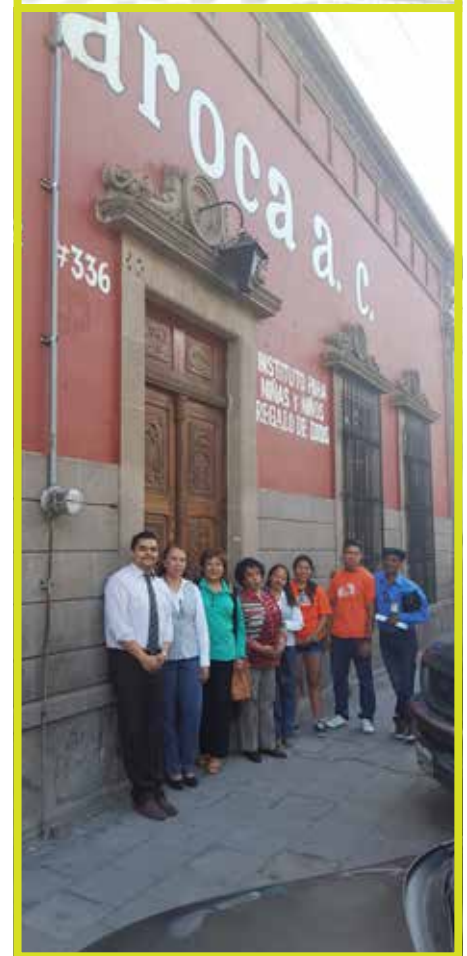
La Casa Baroca además ayuda preparando alimentos a las personas que viven en condiciones de pobreza en el tiradero municipal de Peñasco.