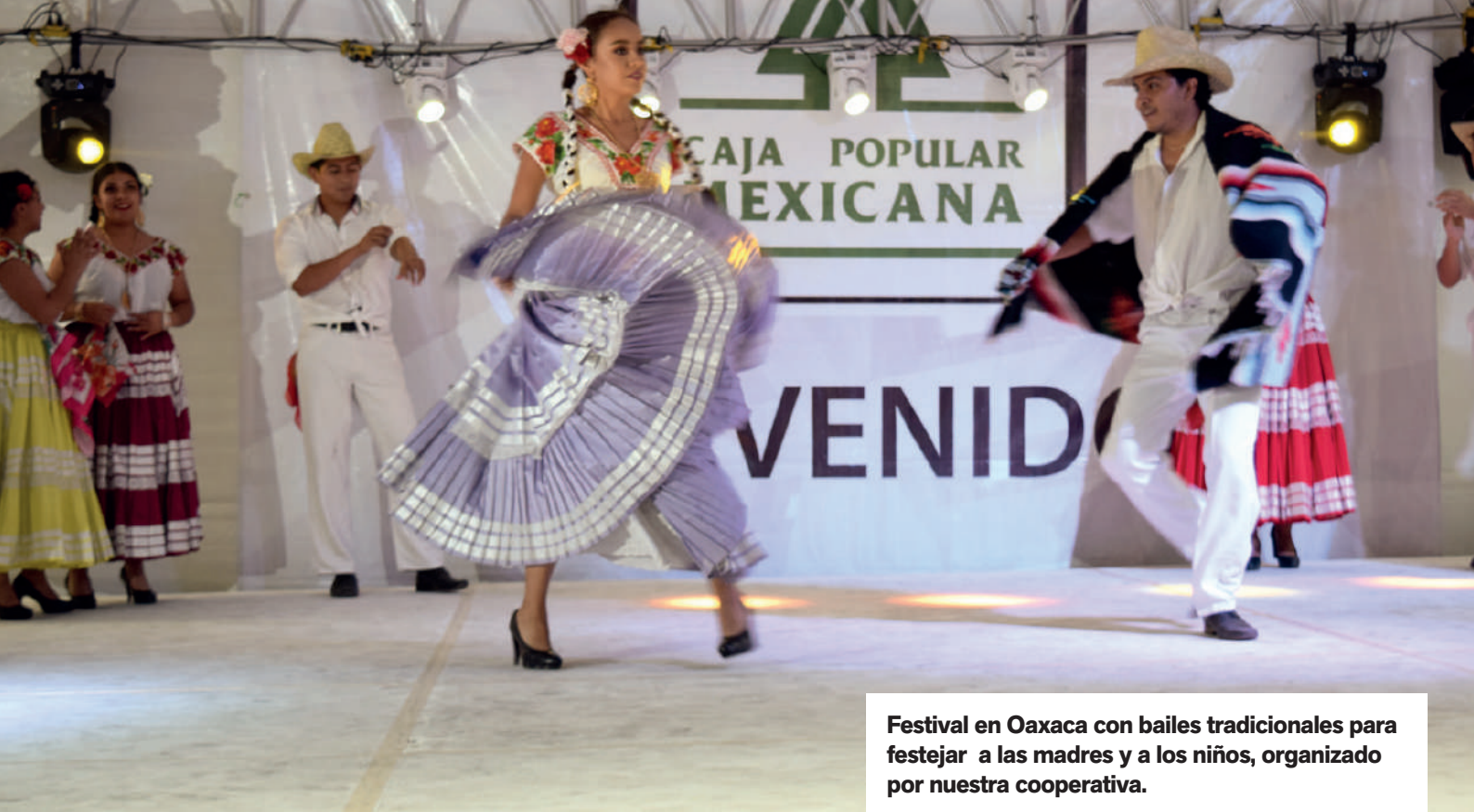
Festival en Oaxaca con bailes tradicionales para festejar a las madres y a los niños, organizado por nuestra cooperativa.